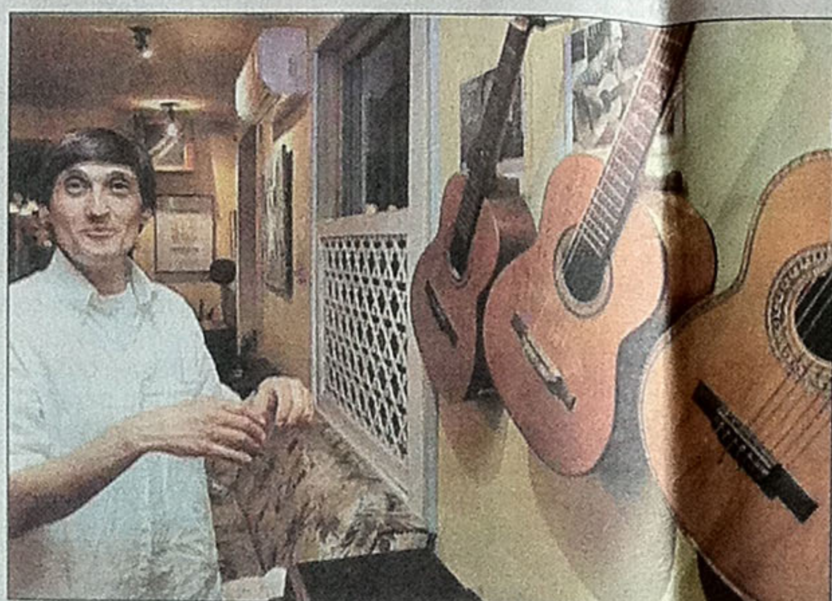
GEORGES GACHOT: "Nana tem influências de Debussy e Ravel"